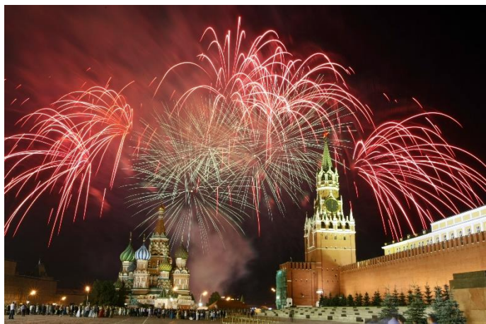
Праздничный салют над городом

Вместе пальчики друзья, друг без друга нам нельзя ( ритмичное сжатие пальцев на обеих руках )